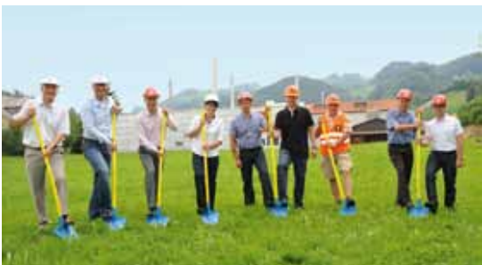
Spatenstich im Wärmeverbund Bühler